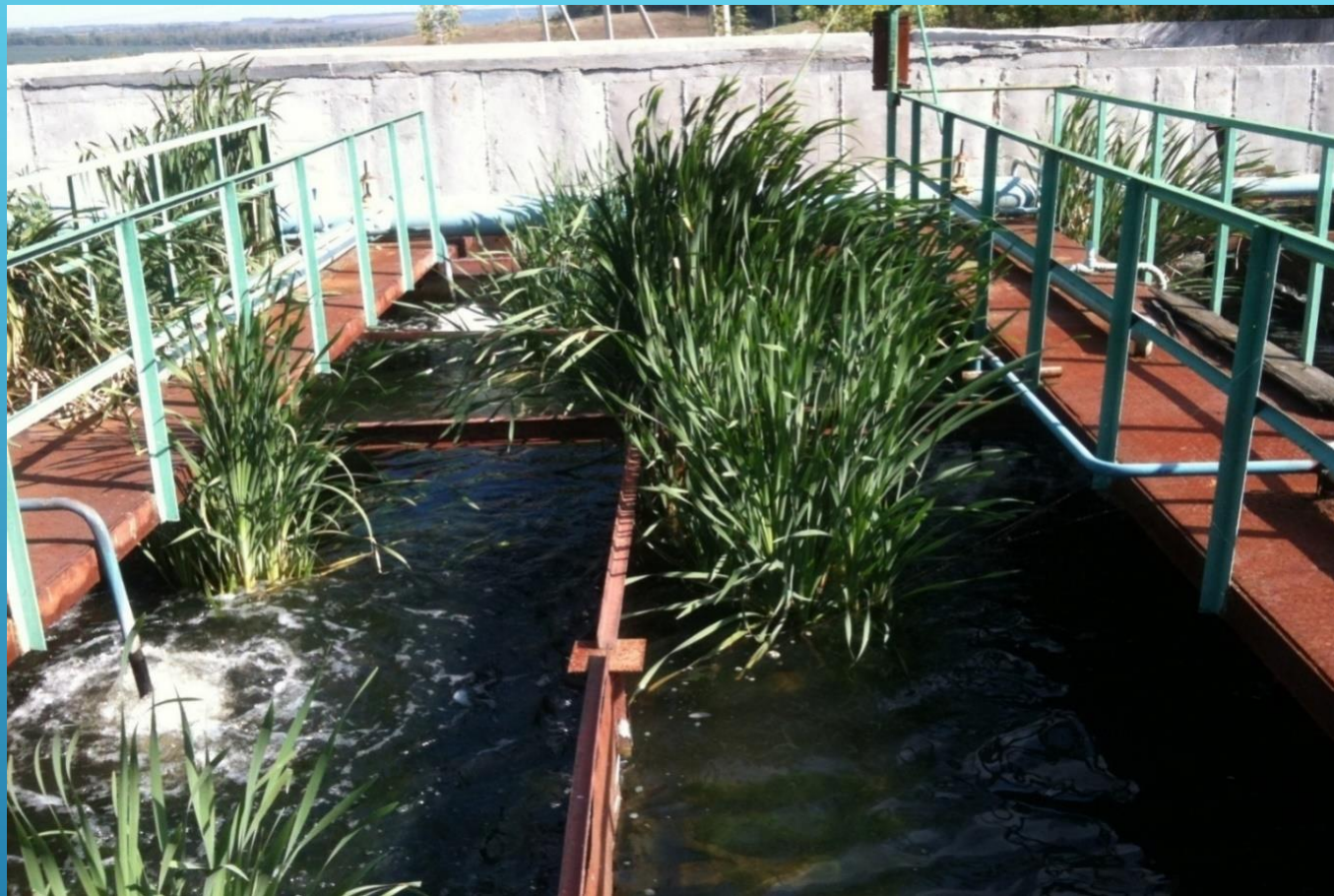
ОЧИСТНЫЕ СООРУЖЕНИЯ ОАО «ЕВДАКОВСКИЙ МАСЛОЖИРОВОЙ КОМБИНАТ»