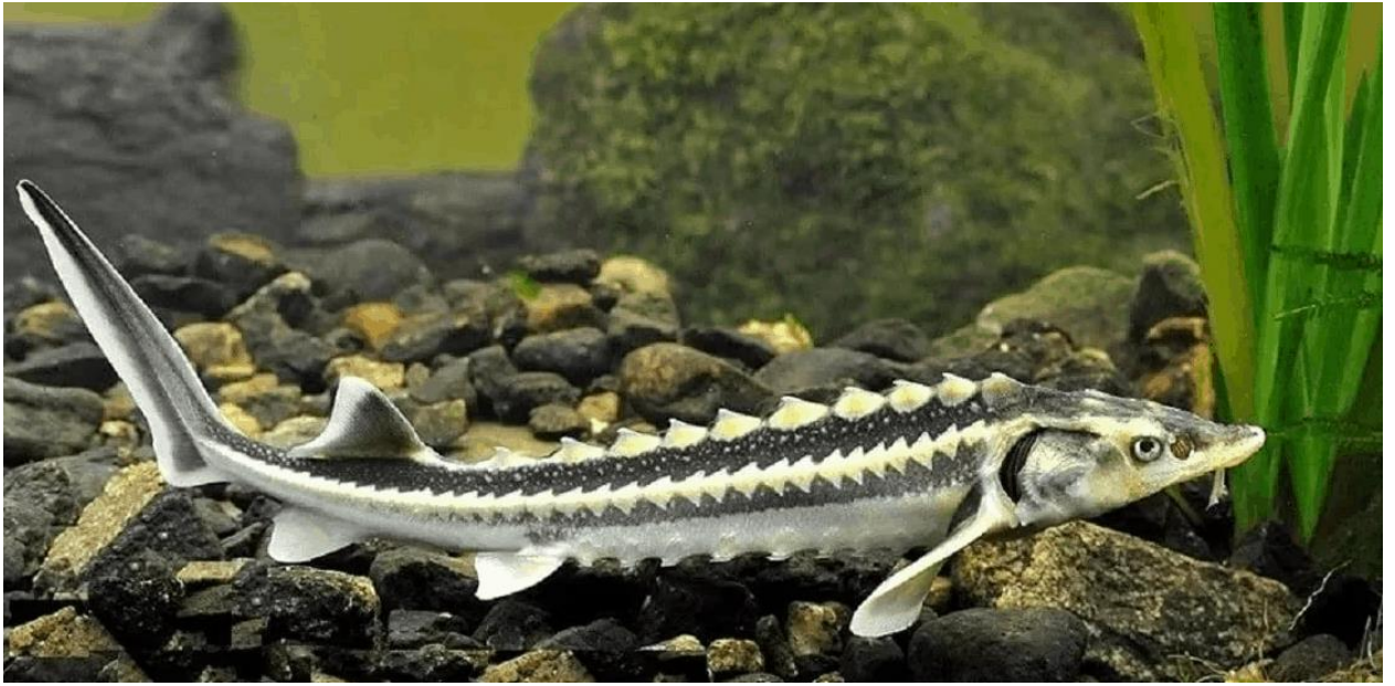
Русский осётр.