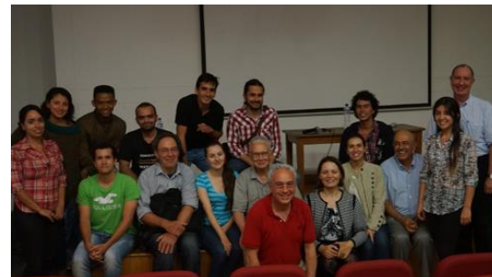
2014: лекции в г. Меделлин, Колумбия (Национальный колумбийский университет)