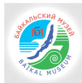
Байкальский музей СО РАН